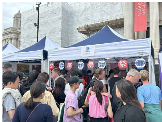
<溢れるほどの方々が来訪>