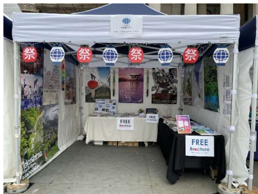
<当事務所ブースの内容>

パンフレットは、地名で選ぶというよりも、表紙のデザインに惹かれて手に取る方がほとんどです。文字のみのものや一见デザインのわかりづらいものよりも、シンプルで鮮やかなパンフレットが好まれる印象です。アンケート調査の結果（後述）も踏まえると、食や自然、伝統文化をモチーフにしたデザインがより手に取ってもらいやすいのではないのでしょうか。