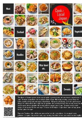
<Cook Local Japan チラシ（一部）>