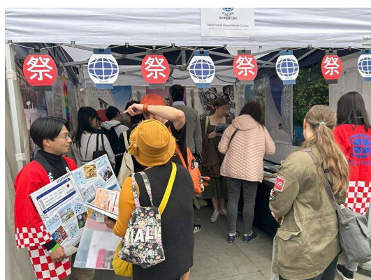
<当事務所ブースでの接客の様子>