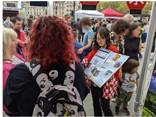
＜アンケート調査の様子＞