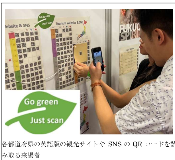
各都道府県の英語版の観光サイトや SNS の QR コードを読み取る来場者

なお、自然環境保全のため、紙のパンフレットやパンフレットを入れるビニール袋などは受け取らない人も欧州には多くおり、そのような来場者に各都道府県の観光情報や英語版のパンフレットを電子的に紹介するという意味でも、当該 QR コード表は有用でした。世界各国でネットゼロへの取り組みが進む中、地域・自治体のPR素材(パンフ、ポスター、ビニール袋、ノベルティグッズなど)についても、今後より一層、環境に配慮したものにする必要があるのではないかと感じています。