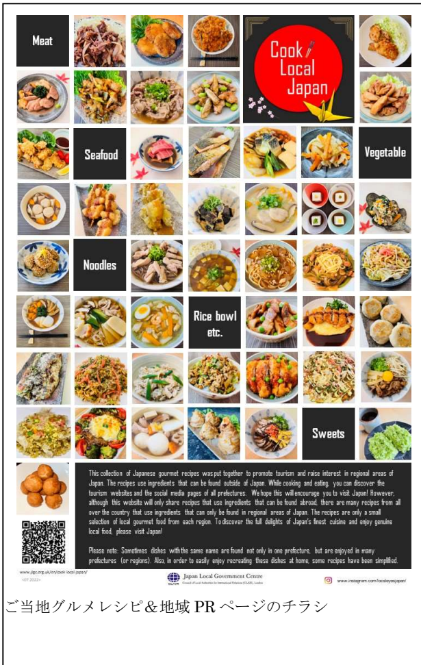
ご当地グルメレシピ&地域 PR ページのチラシ

英国においては日本食に対する関心が継続的に高まっており、近年は寿司、天ぷらのような高級なものだけでなく低価格帯かつ庶民的な巻き寿司、ラーメン、うどん、カツカレーなどのメニューが流行し、定着してきています。このような傾向を踏まえ、クエアロンドン事務所では、日本各地のご当地グルメレシピと観光情報をセットにして提供することで、日本の地域への関心や認知度の向上を図るとともに、観光誘客を促進することを目指して新たな Web ページを作成し、早速今回の HYPER JAPAN で周知しました。