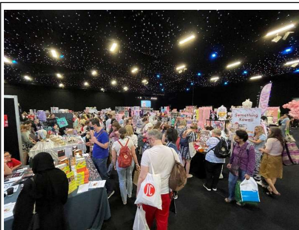
賑わうイベント会場の様子