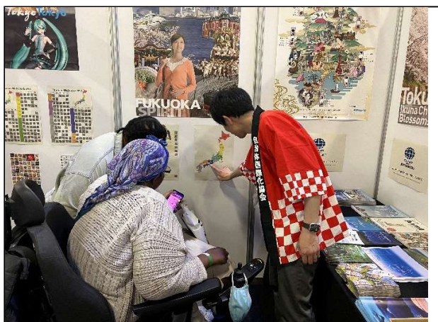
来場者の質問に対応するクレースタッフ

当イベント開催時にはコロナの収束が見通せず、日本への観光旅行(特に個人旅行)がいつから可能になるのかや、渡航前検査の必要性など入国規制(防疫措置)に関する問い合わせが非常に多く、ぜひ来年こそは日本に行きたいと考えているという声を数多く聞きました。また、温泉に関心が高い方も多く、タトゥーがあっても入浴できる場所についての質問にも対応しました。その他、車いすの方からはバリアフリー対応の観光地についての問い合わせがあったほか、和太鼓の体験をしたいという方、大自然を満喫したいという方、アニメ・漫画の舞台となった場所を訪れたいという方など、それぞれ思い思いの旅行プランを考えておられました。