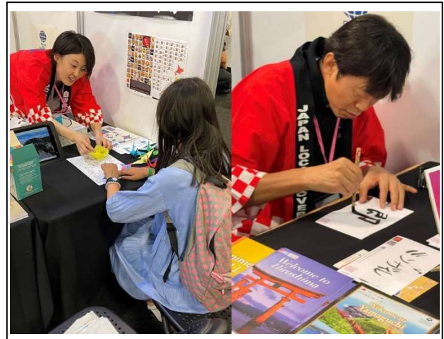
折り紙や書道パフォーマンスにより来場者に日本文化に触れていただく様子