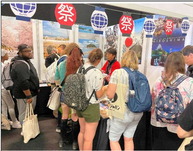
多くの方が訪れるクレアブースの様子