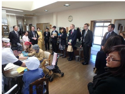
認知症の方向けのグループホーム