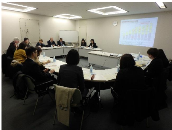
「東京都の高齢者対策」についての都政説明

1月10日（水）、地方セミナーが始まる前、東京都の高齢者施策について学ぶため、東京都庁を訪問し、福祉保健局高齢社会対策部計画課計画調整担当による、都政説明が行われた。東京の高齢者を取り巻く状況や、東京都高齢者保健福祉計画の概要等について学び、日本の介護施設の労働環境改善や、医療保険制度改善及び医療費の本人負担の増額等についての質問が寄せられた。