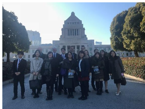
国会参議院前庭にて集合写真

午前中に行われた地方自治体講義の終了後、日本国の国権の最高機関であり、国の唯一の立法機関である国会議事堂を訪問。参議院本会議場等を案内しながら、建物自体の歴史や建築的な特徴、国会の構成、国会の権限及び議院権能等について説明をしてもらった。