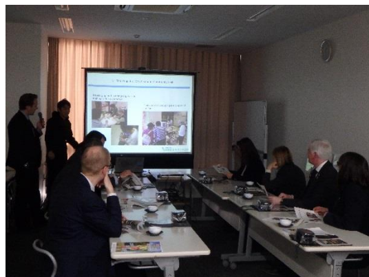
MIRAIE リアンにて取組説明