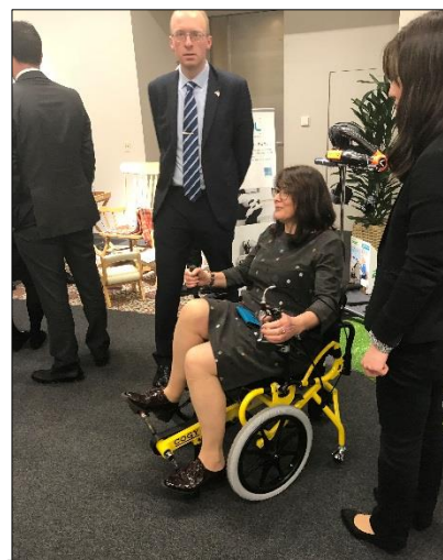
大和ハウス工業株式会社にて介護ロボットに係る商品を体験！

本セミナーのテーマに沿った視察先として、介護用ロボットをはじめとする高齢者向けの商品を扱っている「大和ハウス工業株式会社」を訪問。同社のロボット事業について学び、介護者の腰をアシストし、腰痛リスクを軽減する「HAL (Hybrid Assistive Limb)」や、ベッドが車いすに変形し、移乗の負担を減らすリショナー Plus 等の様々な商品をデモンストレーションしてもらった。最後の10分程度、日本と比較し、イギリスの高齢化や、病院及び高齢者向けの施設等におけるサービスのニーズや、ロボット及びIC