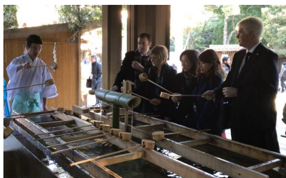
神職より参拝や手水の作法について説明してもらった

明治神宮のことを知り、神道をはじめとする日本文化について学ぶことを目的とし、明治神宮を訪問。明治神宮の大鳥居から本殿まで散歩し、明治神宮の歴史や、日本の神及び正しい参拝方法について学んだ。その後、神職による神道や年間の行事について発表された。アンケート結果によると、参拝訪問で日本、または、日本文化に対する理解を深めることができたとのことである。