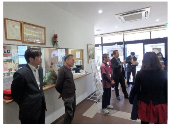
城東コミュニティプラザ HapiSpo 視察

城東コミュニティプラザ HapiSpo というデイサービス、小規模多機能型居宅介護、訪問看護、定期巡回・随時対応型訪問介護看護、夜間対応型訪問介護の5つの介護サービスを実施している在宅支援型複合施設を訪問した。静岡市内の高齢者がいつまでも元気でいられるための「居場所づくり」の取り組みや、カルチャースクール、カフェテリア等の事業について学んだ。また、最後に城東コミュニティプラザ HapiSpo の利用者と英語で交流ができた。