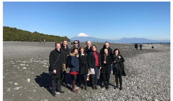
静岡市世界遺産三保松原にて

富士山世界文化遺産の構成資産に登録された三保松原に行き、ボランティアガイドにより御穂神社や、約500mの松並木の「神の道」等に関して観光情報の提供、案内がなされた。