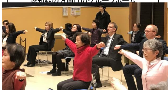
しぞ〜かでん伝体操体験・参加者交流