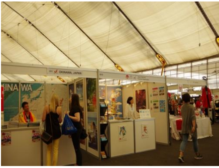
左：沖縄 中：JNTO 右：JAL