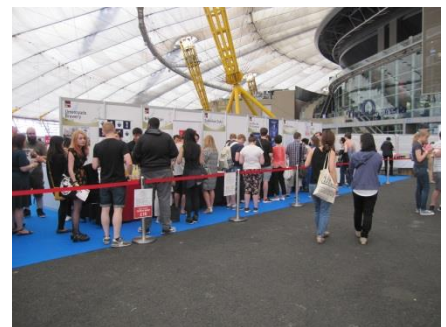
日本酒の試飲 (有料)